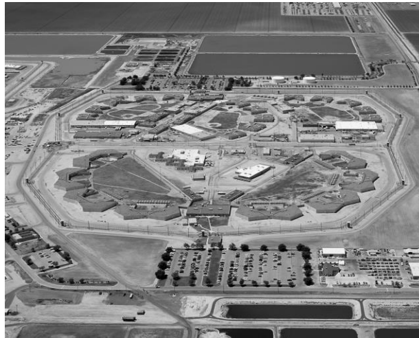
Prisión Estatal de Máxima Seguridad de California, “Corcoran”

En Estados Unidos hay 2 millones 300 mil presos. Uno de cada 100 adultos vive tras las rejas. Uno de cada 9 afroamericanos varones de entre 20 y 34 años de edad están privados de la libertad. De hecho hay más afroamericanos adultos en la cárcel que en las universidades. Se estima que entre 25 mil y 80 mil internos se encuentran bajo confinamiento solitario absoluto dentro de prisiones de súper máxima seguridad en un total de 44 estados.